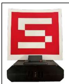
[圖三] 固定標靶示意圖

比賽場地共設置 5 組固定標靶，靶面為長 17cm x 寬 17cm 的原廠紙卡 (如圖三)。紙卡上為數字 1~5 號進行隨機擺放位置。瞄準紙卡靶心，以彈道燈光束射擊，完成擊倒後即可得分。