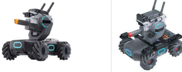
[圖一] 參賽機器人示意圖