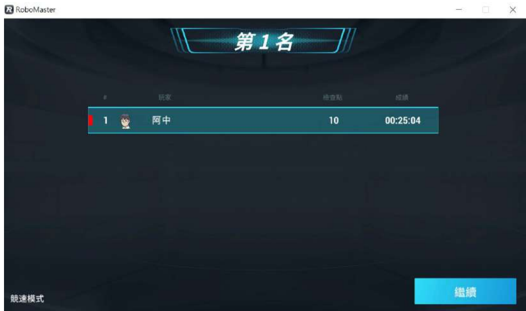
[圖六] 競速模式分數顯示示意圖