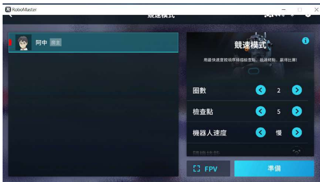
[圖四] RoboMaster程式；競速模式示意圖