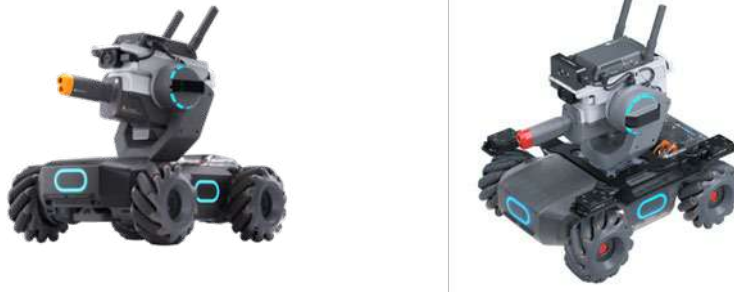
[圖一] 參賽機器人示意圖