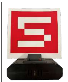
[圖二] 固定標靶示意圖