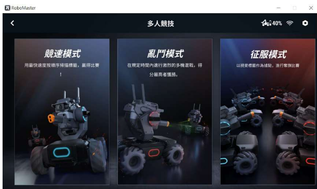
[圖三] RoboMaster程式；競速模式示意圖

(一) 啟動 RoboMaster 程式，進入多人競賽、競速模式。(如圖三、圖四)