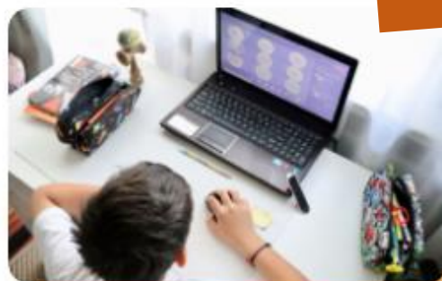
網路課程 - OnO