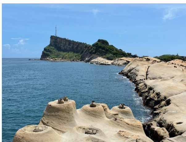
圖 1 台灣地景保育網任選一張地景的照片或自行拍攝或選用照片(請務必註明出處)